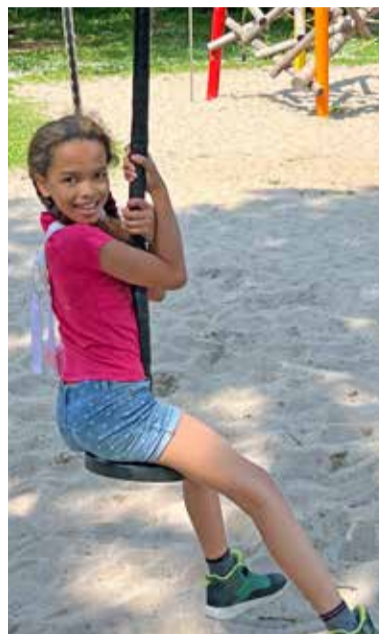
Das Spielgerät im Stil eines Kettelkarussells war mein absoluter Favorit. Hiermit lässt es sich durch die Lüfte fliegen.