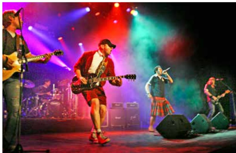
FULL OF LOVE, die AC/DC tribute Band rockt am 5. Juni die Veranstaltung von HoTi-Events