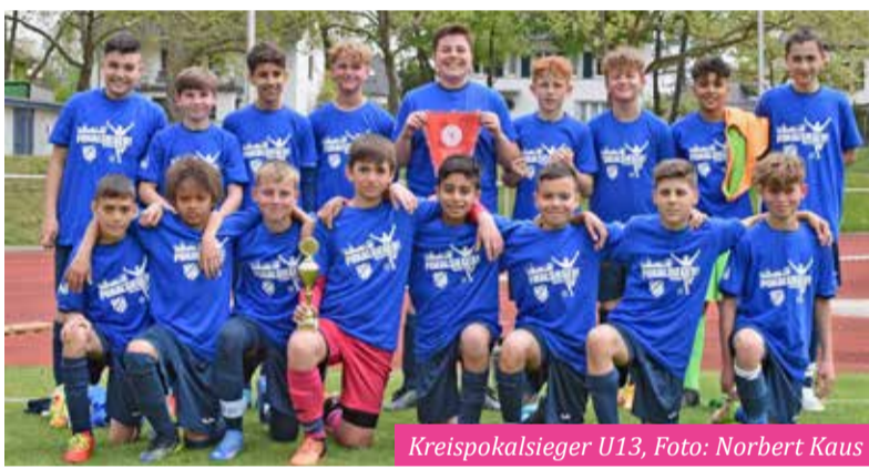
Kreispokalsieger U13.

D-Junioren Gruppenliga - Abstiegsrunde: Drei Spieltage vor Schluss bringt die U13 mit einem Auswärtssieg durch Tore von C. Toraman, N. Riedel und S. Elsayed den Klassenerhalt in trockene Tücher: St. Stephan Griesheim U13/D1 - U13/D1 2:3. Kreisliga Halbfinal-Hinspiel: Die