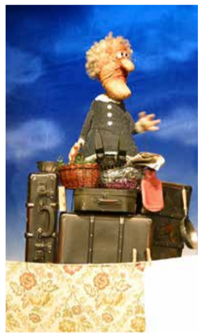
Das „Kikeriki Theater ist mit „Achtung Oma. am 31. Mai bei HoTi-Events zu Gast

Den Ausfall der Bischheimer Kerb im Jahr 2020 kompensierte er mit ei-