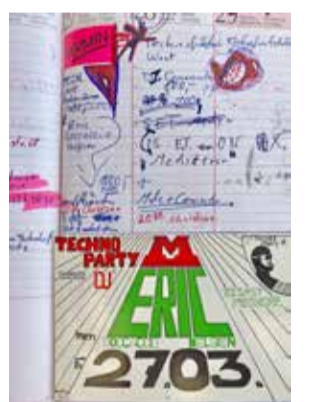
DJ Taucher: Einblick in einen frühen Tour-Kalender

Mit 124 „beats per minute“ sieht man DJ Taucher seit einem Jahr regelmäßig auf twitch.tv, rund 10.000 follower sind dabei. Man sieht schwabende Köpfe, allerlei Symbole wabern umher, Leuchten glühen auf, ein einziger Farben-Rausch im Welten-Raum. Emojis fliegen durchs Bild, grafische Einsprengel hinterher. Virtuelle Räume öffnen sich, unendliche Gänge ziehen die Zuschauenden in Bann. Und wie es sich für ein Froschmann-Ambiente gehört, blühen Seerosen auf, schwimmen Fische wie im Aquarium hin und her. Mit rhythmischer Gleichmäßigkeit der elektronischen Bässe und Trommeln gibt's was auf die Ohren. Und auch der Intellekt wird mit „mit moderner Lyrik oder dem alten Adorno“ gefordert. Im Chat der User liest sich das so: „Da fliegen einem nicht nur Bretter entgegen, sondern gleich ein ganzer Sound-Schrank.“ – „Einfach echt ein Genuss.“ – „Eine Augen- und Ohrenweide.“ – „Such a dream.“ – „Just love and good vibes.“ – „Zum Glück zauberst du für uns alle.“ Und immer wieder dazwischen Werbung, die möglicherweise auch über die Zielgruppe Aufschluss gibt: Ein Versandhaus, ein Hersteller von Pickelcreme, eine Fleischklops-Bräterei, eine Kaguummi-Marke, ein Männer-Deo und ein Playstation-Vertrieb. Mit einem „Donation Button“ kann man dem Musikproduzenten eine Anerkennung zukommen lassen.