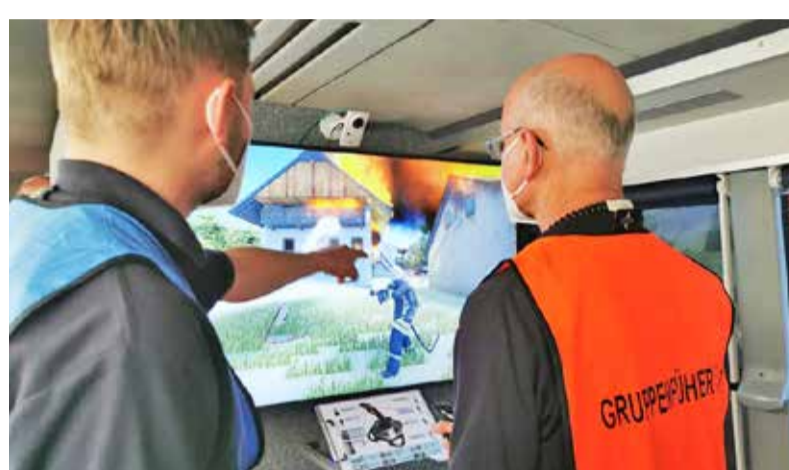
Kameraden der Feuerwehr Kelkheim beim Training