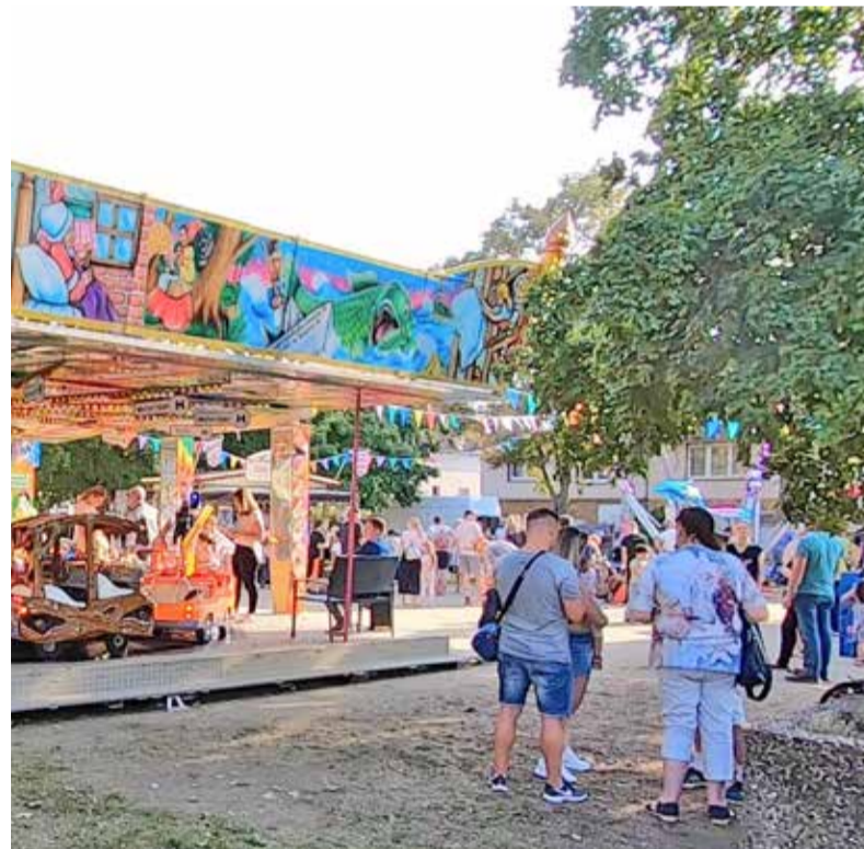
Archivfoto der „Bischofker Kerb light“ in 2021

Fr, 13. bis Mo 16.05.2022 | 13 bis 21 Uhr