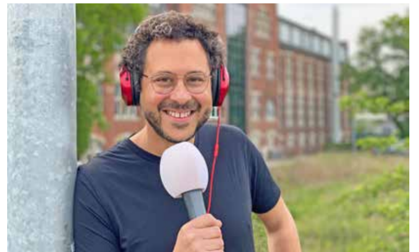
Am Mittwoch, den 18.05., spricht der neue Gustavsburger Pfarrer (evangelische Kirchengemeinde) die Mittwochsgedanken auf www.gigutogo.de/mittwochmorgen .

Radio hebel Kompetenz in Service und Technik