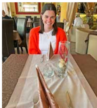
Mimmo ist auf jeden Fall empfehlenswert und es lohnt sich, dieses zu besuchen!