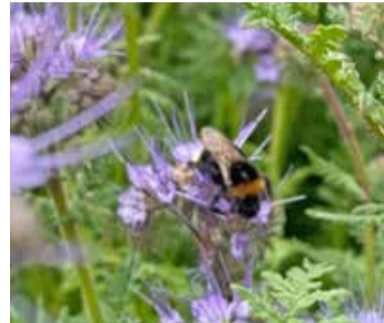
Diese Hummel freut sich – wie alle ihrer Insektenkolleginnen – über den vielfältigen, blühenden Lebensraum

Eine Entwicklung des Projekts als Einkommensquelle ist allerdings nicht geplant. „Wenn wir einen Teil der Kosten für die Samenmischungen und den Einsatz der Fläche zurück bekommen, ist die Sache für uns in Ordnung. Letztes Jahr sprangen wir mit dem Projekt ins kalte Wasser und wurden