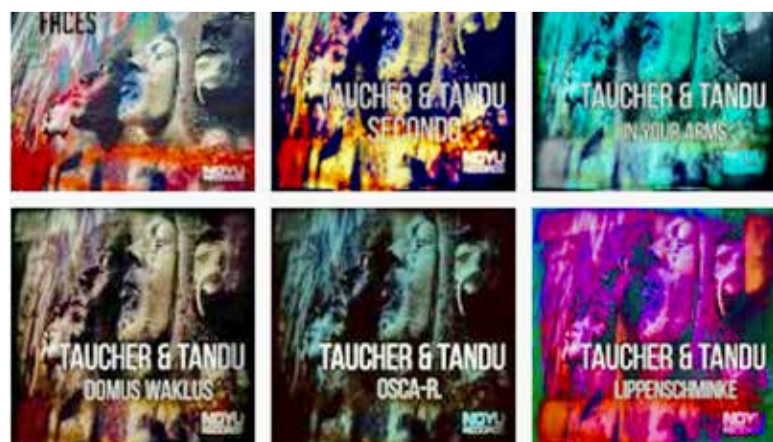
Cover der CDs