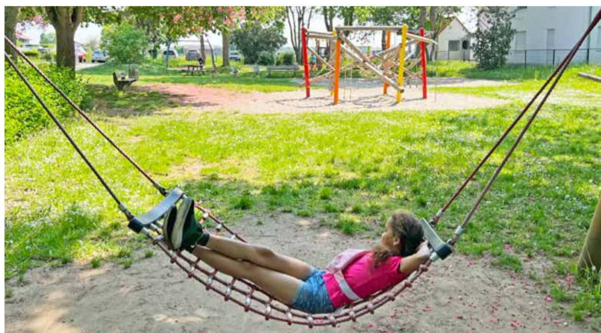
Nach dem Toben lasse ich in der Hängematte mit Blick über den gesamten Spielplatz meine Seele baumeln.