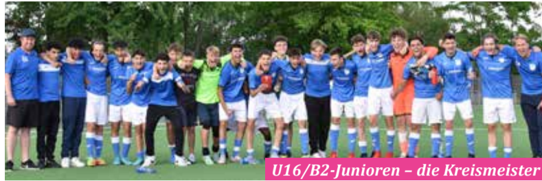
U16/B2-Junioren - die Kreismeister

C-Junioren Gruppenliga: Die U14 vollendete ihren Superlauf in der Rückrunde, und bleibt auch im 9. Spiel in Folge ungeschlagen. Den Verbleib in der Gruppenliga hatte das