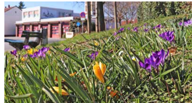
Auf dem Ortsdamm neben der Feuerwehr kommt seit Jahren die Frühlingsblumenmischung wieder hervor.