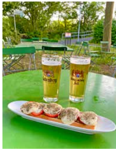
sogar schon ab 11 Uhr.

Wer also nach Feierabend mal eine gute Möglichkeit sucht, um mit einem Getränk und etwas zu Essen in der Natur zu entspannen, ist hier genau richtig! Der Biergarten hat täglich von 16-23 Uhr geöffnet und sonntags