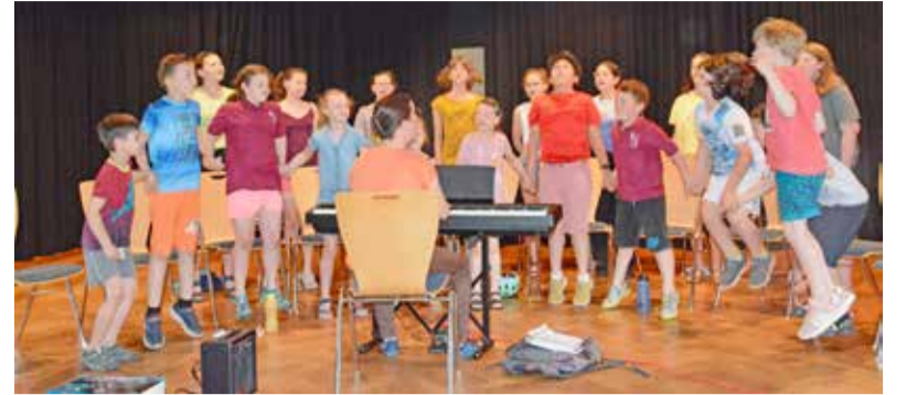
Die Kinder geben beim Singen alles und heben dabei sogar hin und wieder vom Boden ab.