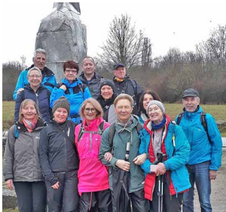
Ihre Jahresauftaktwanderung führte die Wandergruppe der TSV Ginsheim in die Weilbacher Kiesgruben.

TSV Ginsheim – Wandern – Die nächste Wanderung der TSV Ginsheim findet am Sonntag, dem 29.03. statt. Ziel wird die Traumschleife „Murscher Eselschleife“ sein. Weitere Informationen und Anmeldung für Interessierte gibt es auf der Homepage des Vereins unter www.tsv-ginsheim.de . Hier findet man auch das Jahresprogramm der Wanderabteilung mit weiteren geplanten Wandertouren über unterschiedliche Distanzen und Schwierigkeitsgrade. Traditionell beginnt die Wanderabteilung der TSV Ginsheim ihr Wanderjahr mit einer Wanderung in der Region – in diesem Jahr zu den Weilbacher Kiesgruben. So führen am 02.02. 14 TSV-Wanderer zu den Weilbacher Kiesgruben. Der Parkplatz am Besucherzentrum war der Startpunkt der