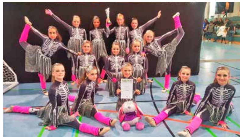
Beim ersten Auftritt in der Tanzsaison 2020 erreichten die „Magics“ beim Turnier in Hochheim den 1. Platz.