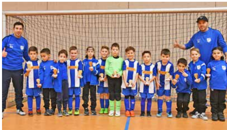
Die G1-Junioren des VfB Ginsheim – Altrhein-Cup-Sieger 2020